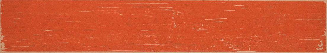
IRRADIADOR NO. 2, Back Cover