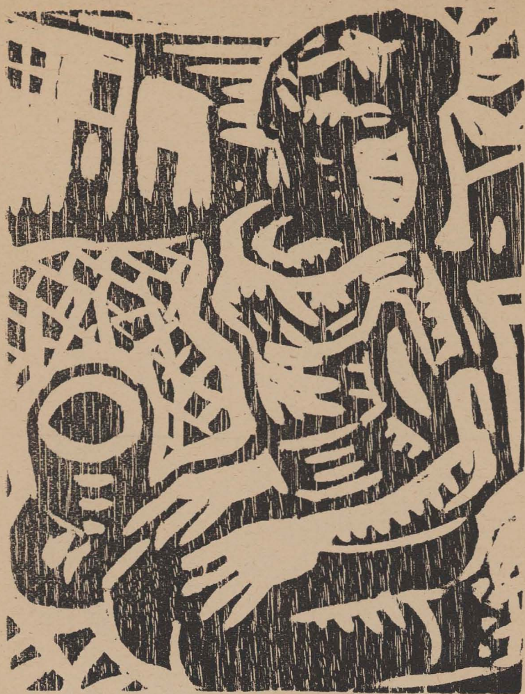
GRABADO DE MADERA DE JEAN CHARLOT