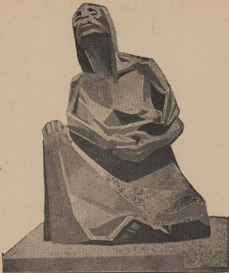
ESCULTURA DE GUILLERMO RUIZ