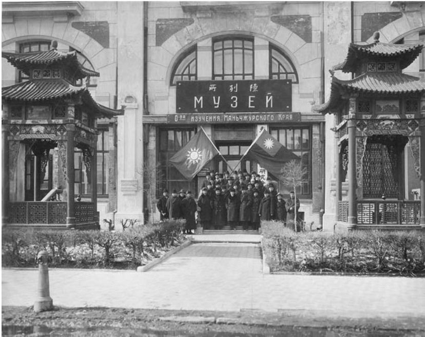
Рис. 1. Деятели Общества изучения Маньчжурского края. Харбин, Китай, 1924? г.

основу владивостокское Общество изучения Амурского края, позаимствовав отчасти и название. В циркулярном письме властям говорилось: