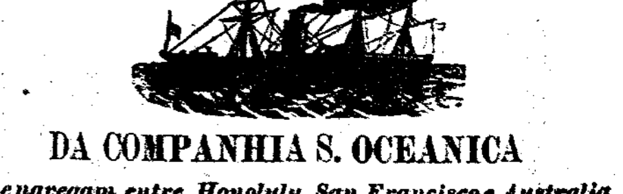
Tabella Da carreira mensal dos vapores