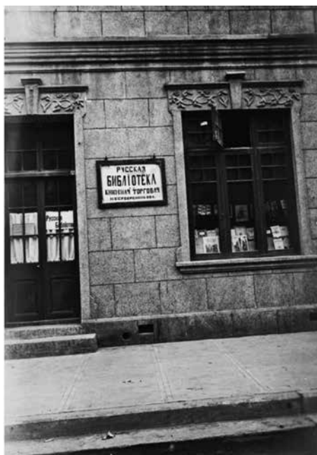
Библиотека И.И. Серебренникова в Тяньцзине (1925—1927 гг.)

В январе 1925 г. Серебренниковы купили квартиру на Дикинсон-род, торговом центре русской общины в Тяньцзине, став владельцами собственного жилья и небольшого предприятия в Китае. Их квартира представляла собой две просторные комнаты на нижнем этаже. Здесь разместились и библиотека с магазином. Две такие же комнаты находились на втором этаже, там же были кухня с ванной и еще две небольшие комна-