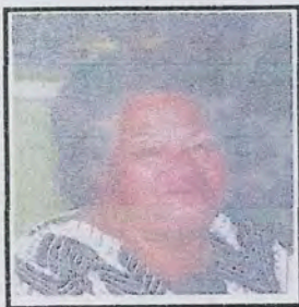
O se faletua sa galue malosi e tautua i lana Ekalesia e ala i lona tofi