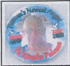
Matua - Konelio Asiata - Lotofaga Safata ma Talaia Leau i